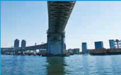
公共事業インフラ

実際に現場で活用している インフラ点検の実績 と 日本最大規模のドローンスクール を運営している 「ダブルノウハウ」 の空撮サービス