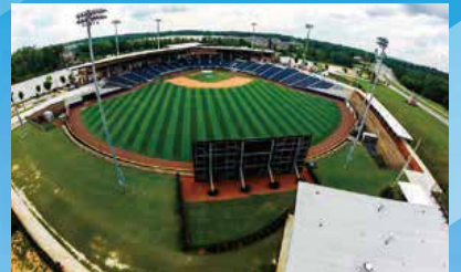
メディアエンターテインメント