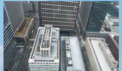
家屋調査・不動産関連

4K カメラや赤外線カメラを搭載したドローンを活用して、 インフラ点検から災害救助、調査、エンターテインメントなど、 御社の様々なニーズに応えることが可能です！